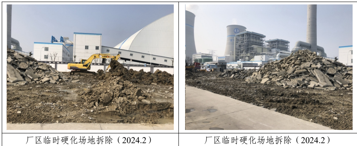
表 3-6 本季度实施水土保持措施示例